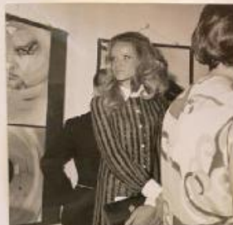
Verushka al Diaframma nel 1968