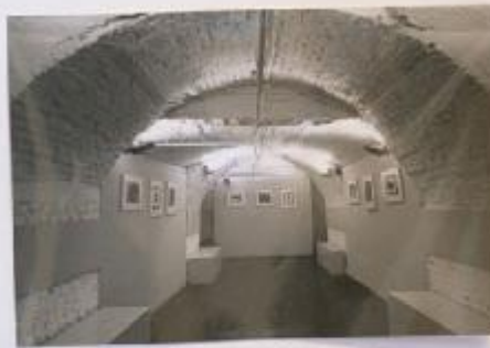
Il piano ferroviario di Via Novara 12