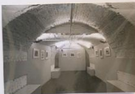
Il piano seminterrato di Via Brera 10