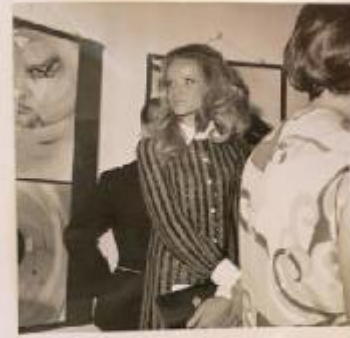
Il piano di Via Novara nel 1962