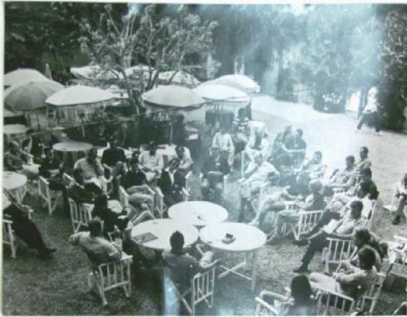
Il gruppo nella villa