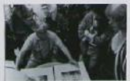
ARLES 1990, via S. Stefano