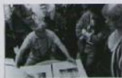
ARLES 1990, via Sostane

Ad ARLES, nell'antico Teatro comune in occasione della giunata dedicata alla FOTOGRAFIA italiana di fine Ottobre i 25 anni della madre il dipendente in particolare, sotto la direzione di Giuseppe Colombo e sotto la guida di Franco Sestini, si è tenuto un festival dell'arte di Giuseppe Colombo e della via Sostane, alle 19.30 di via Sostane, 1992.