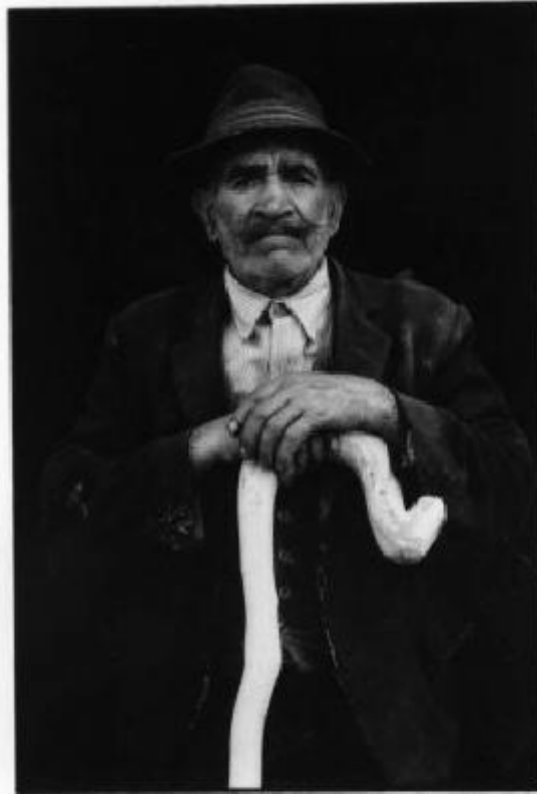
insanguine "cafagne" di Rotonda (Comitate) Casso '78

Le due tavole ripercorrono le stagioni di una ricerca fotografica che risale al 1964 in Basilicata. Attualmente la fotografia è uno dei mezzi che più consente di lavorare all'interno di un territorio (di Basilicata), per un lavoro intimo della realtà.