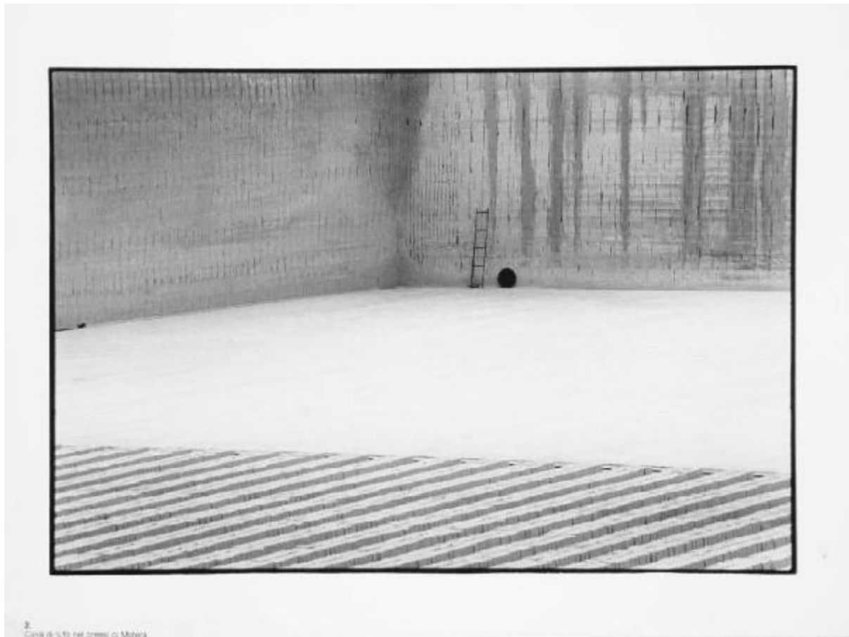
2. Cava di tufo nei pressi di Matera

Link risorsa: https://www.lombardiabeniculturali.it/fotografie/schede/IMM-10110-000068/