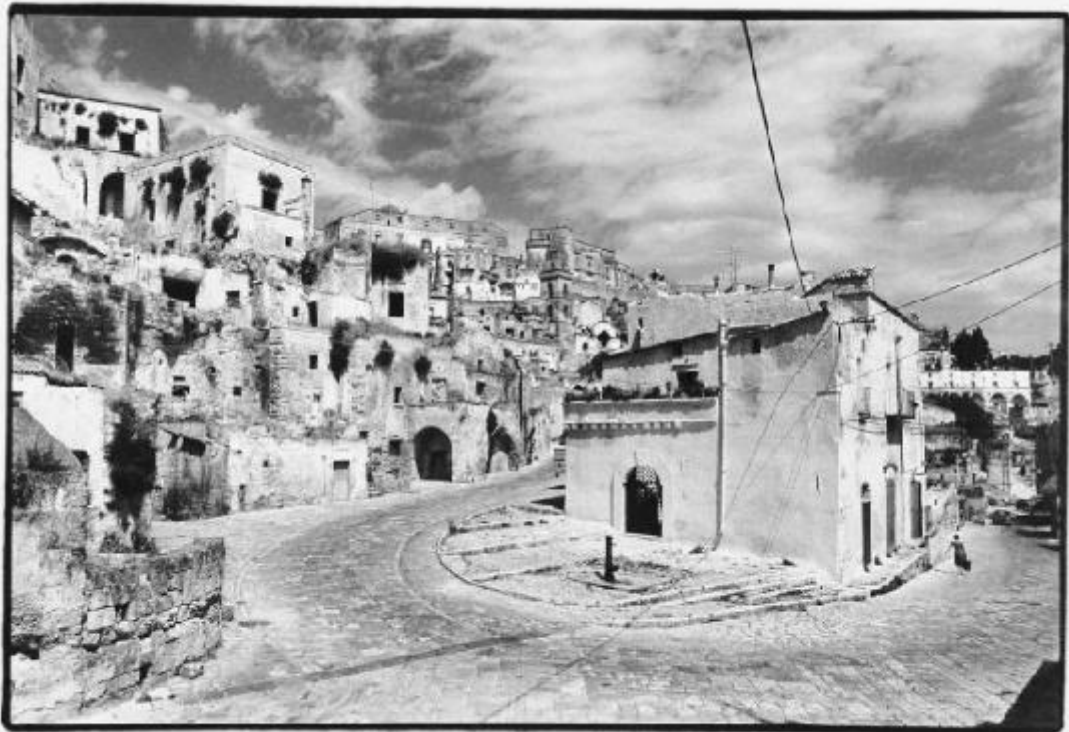
19. 19. Matera, i Sassi