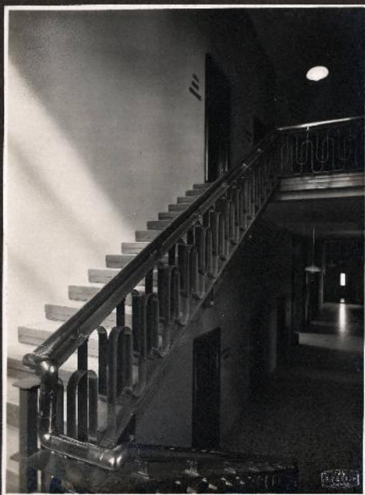
Particolare dello scalone