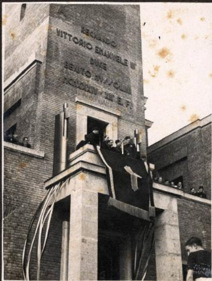
S.E. il Segretario del Partito riceve l'omaggio della popolazione