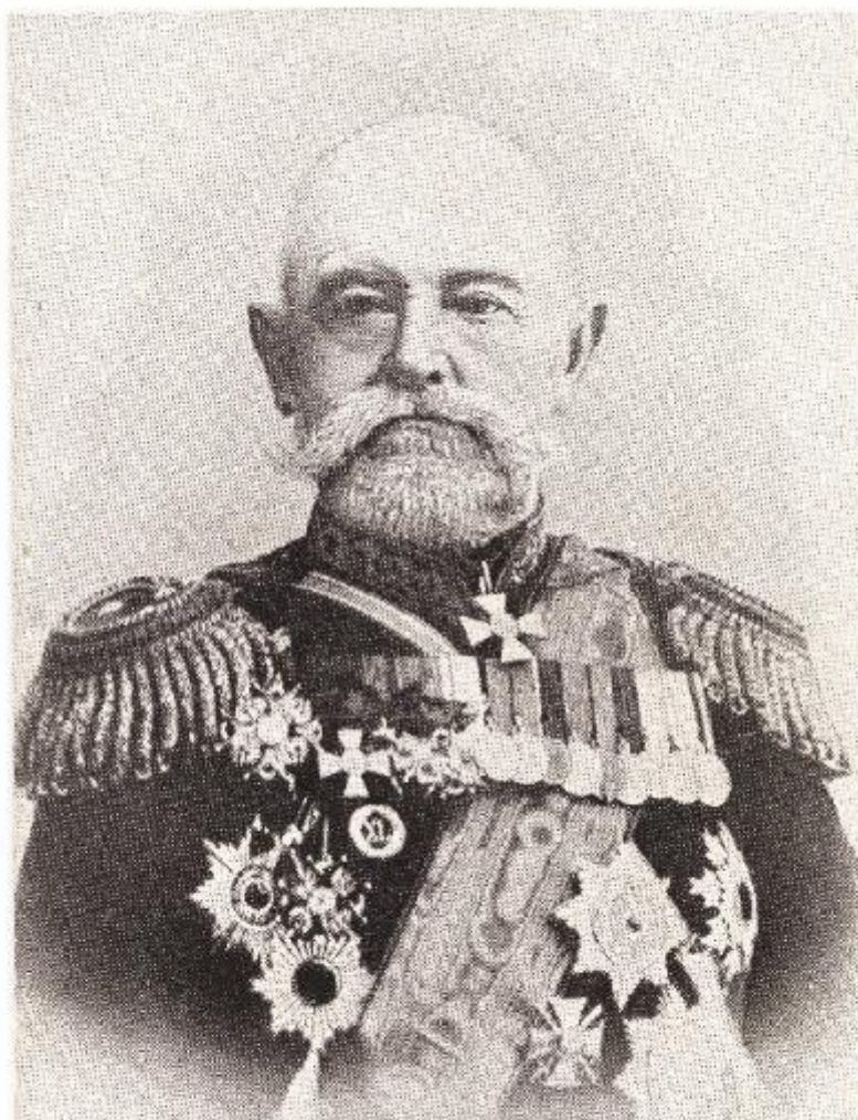
Ген.-лейтенантъ Н. П. Линевичь