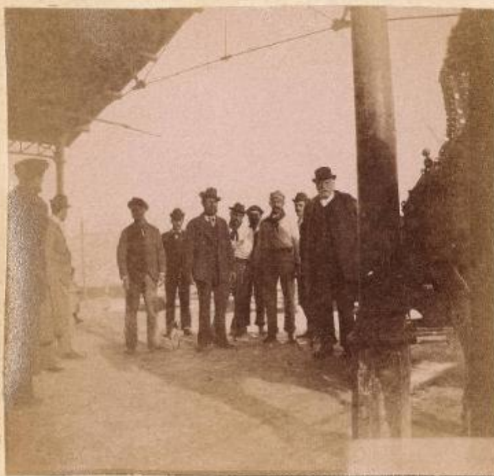
Alla Cala - nel porto di Palermo