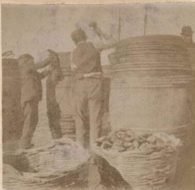
Preparazione dei bozzoli a Siracusa