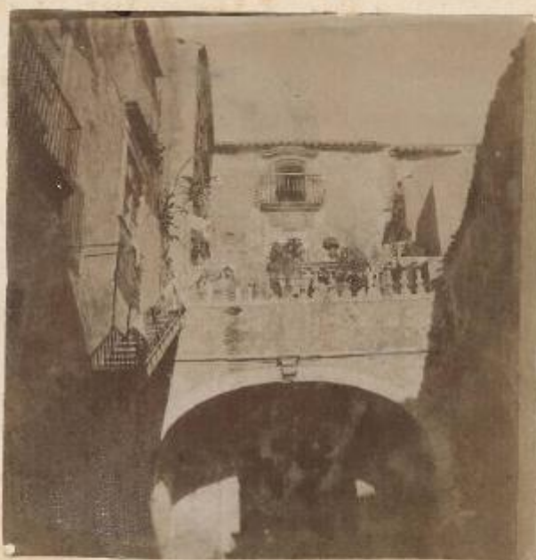
L'interno di un patarico a Siracusa in Via Maccherone