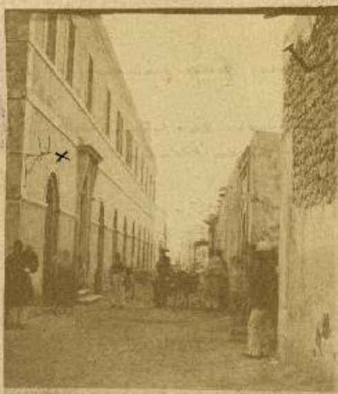
x Casa della Stazione. 1880 - M. Compagnoni