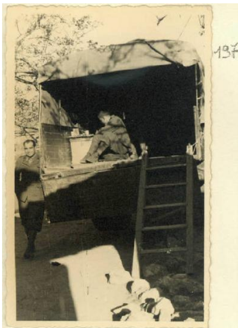
Cangoj : (alta Valle del Devoli) : l'autocarro del comando col centralino telefonico