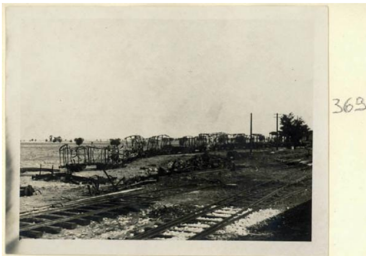
25-VII: convoglio distrutto dagli Stukas