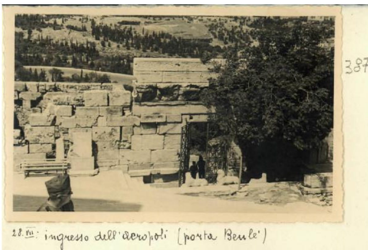
28. vii: ingresso dell'aeropoli (porta Beulé)