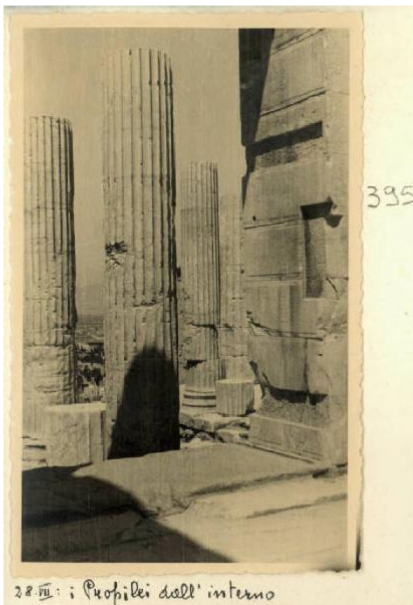
28.Ⅳ: i Propilei dell' interno