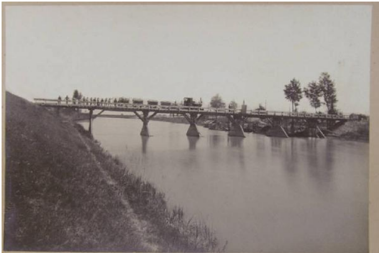
Ponte provvisorio di servizio sul fiume Secchia - in maggio 1901