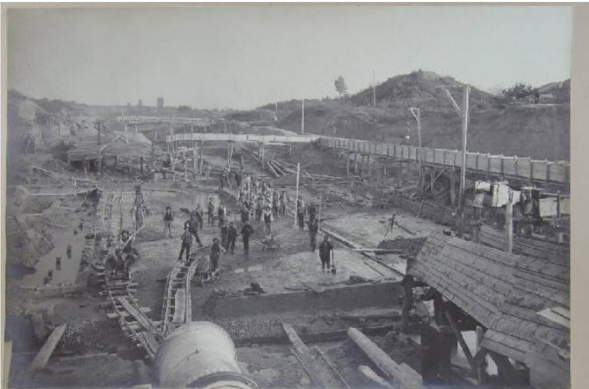
Prote-fuoco Sicchia - Contrattazione col S. Pietro - Stato da basso al 20 Maggio 1911