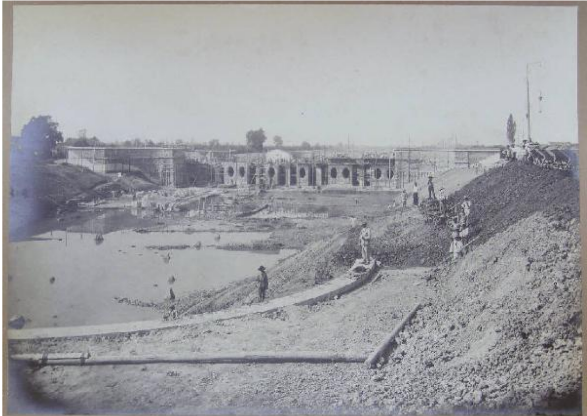
Stabilimento Idroelettrico Marzagone