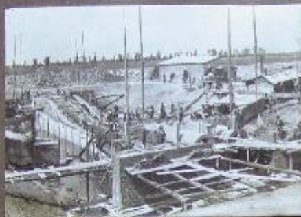
Casa dei ferri