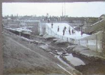
Isola degli spicconi