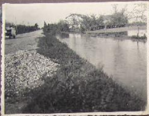
Bacino Campolungo 1934 (C. Carrà e M. Moliterno)