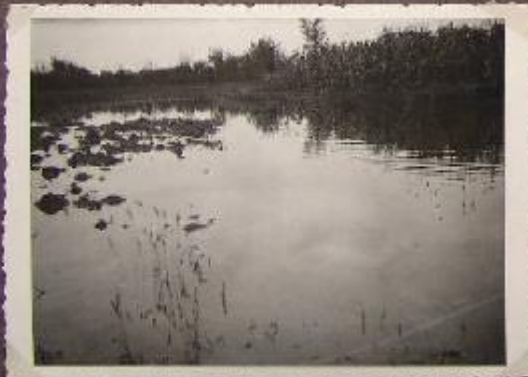
Bacino Sossella Campolungo Lurta (S. Cognigni 1934)