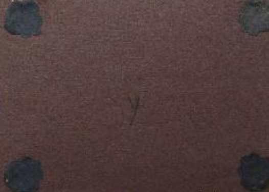
Bacino Care Schiappa (S. Boninello 1934)