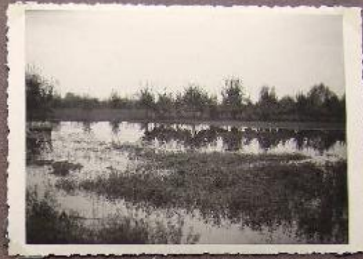
Bacino Sest. Campolungo Biala (S. Cognigni 1924)