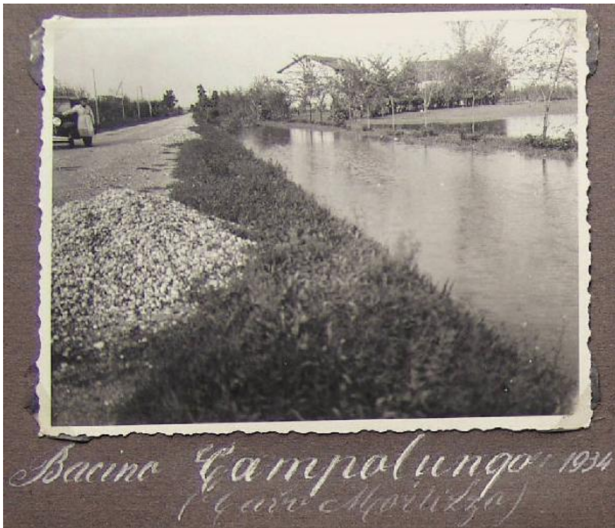
Bacino Campalungo 1934 (Carri Morlizza)