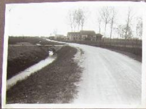
Boccale Correggioli (da monte a valle Langobolla Strada Boccale)