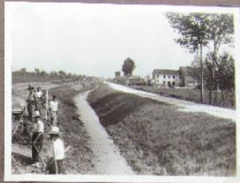
Boccale Correggioli (da monte a valle)