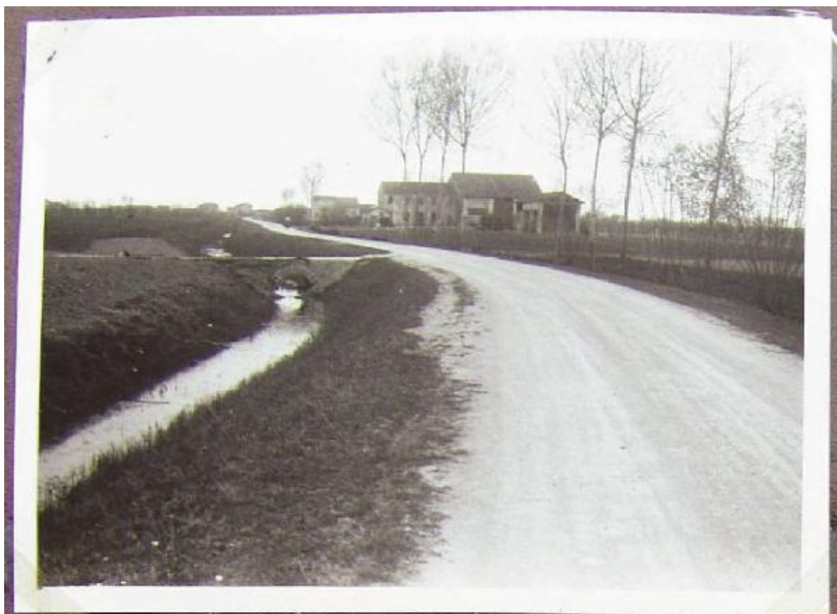
Boccale Correggioli (da monte a valle lungo la strada Boccale)