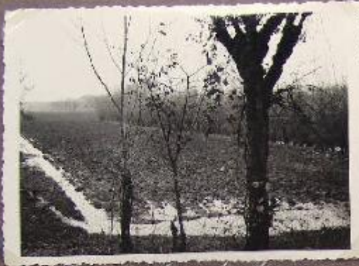
Bacino Canale L'ara (Colleggianna 1936)