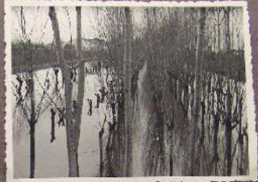
Bacino Canale L'ara - Muzza (L. Beninella - Colleggianna)