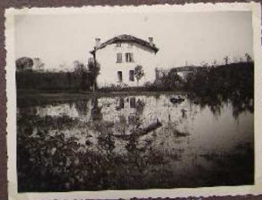
Bacino Canale L'ara 1936 (Luzza - L. Beninella)