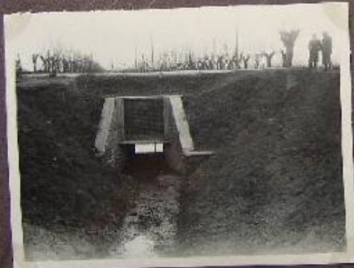
Canale So. Vecchietto