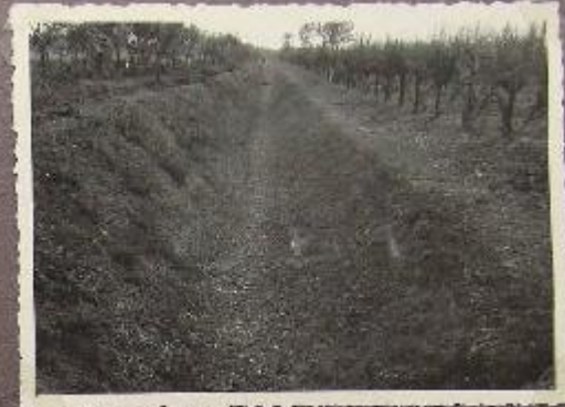
Canale So. Vecchietto (Ottobre 1946)