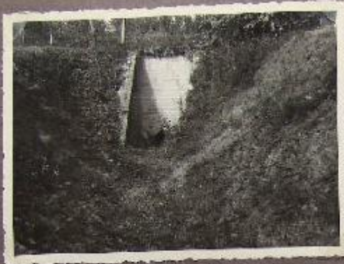
Canale So. Vecchietto - Ponte Strada S. Giovanni - Gonzaga 1946