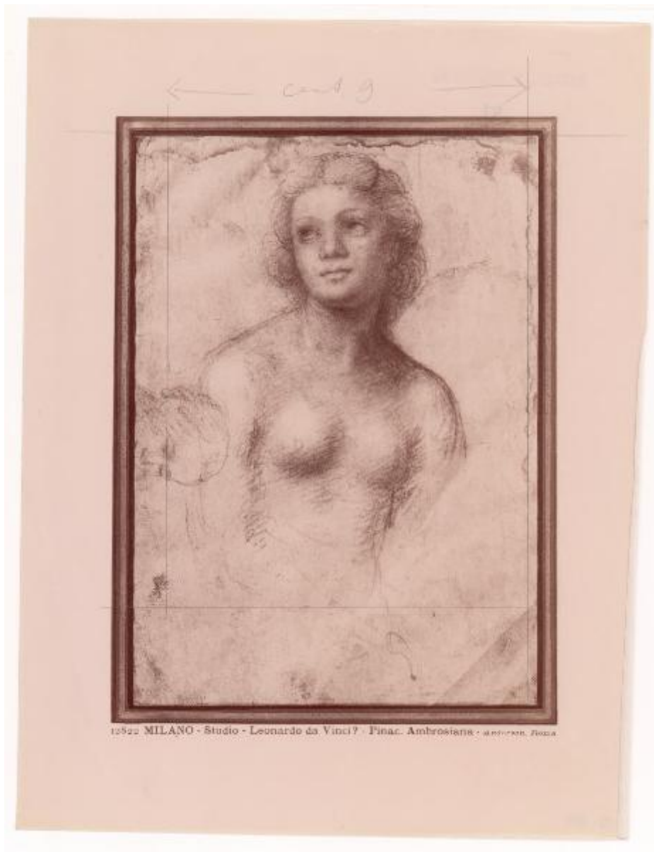
12522 MILANO - Studio - Leonardo da Vinci? - Pinac. Ambrosiana - ambrosiana, Italia