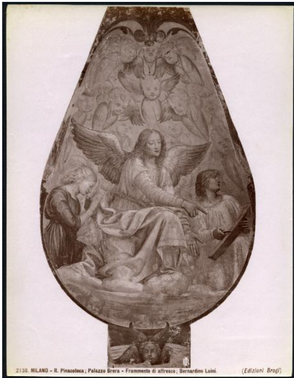
2138. MILANO - R. Pinacoteca; Palazzo Brera - Frammento di affresco; Bernardino Luini.