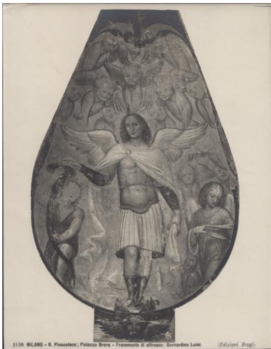
2139. MILANO - R. Pinacoteca; Palazzo Brera - Frammento di affresco; Bernardino Luini.