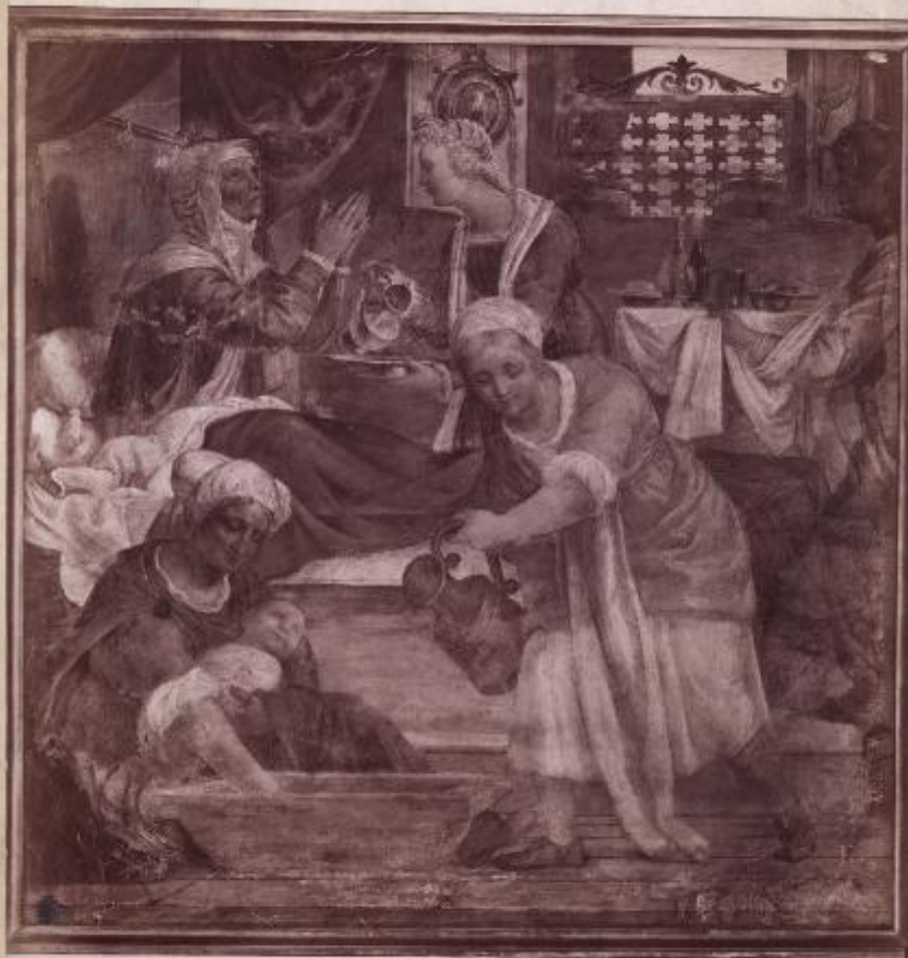
2141. MILANO - R. Pinacoteca; Palazzo Brera - Nascita di Maria Vergine; Bernardino Luini. (Edizioni Brogi)