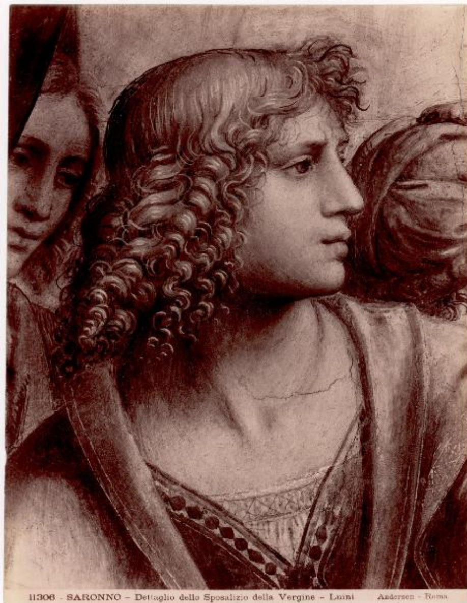
11308 - SARONNO - Dettaglio dello Sposalizio della Vergine - Luini - Andersen - Roma