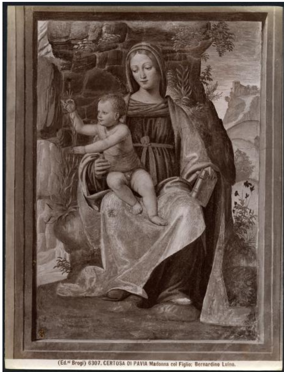
(Ed. Brogi) 6307. CERTOSA DI PAVIA Madonna col Figlio; Bernardino Luino.