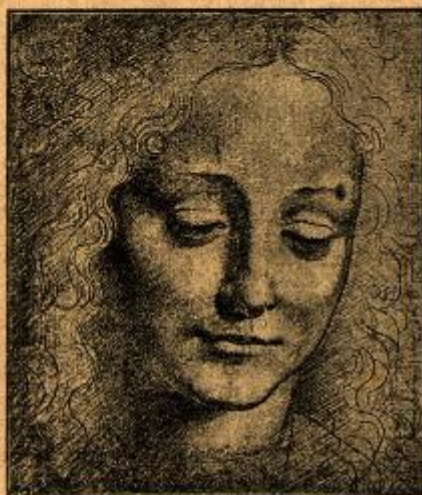
Leonardo-Handzeichnung. Florenz. Uffizien. Bedeutend verkleinerte Probe-Illustration.

Lebensskizze und Forschungen über sein Verhältniss zur Florentiner Kunst und zu Rafael.