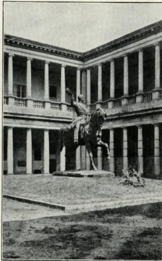
La Statua equestre di Napoleone III Sull'anno 1861 all'anno 1926 nelle I a Corte del Palazzo del Senato, in Milano.