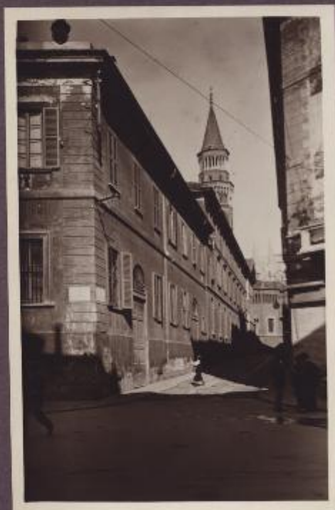
Via Palazzo Reale