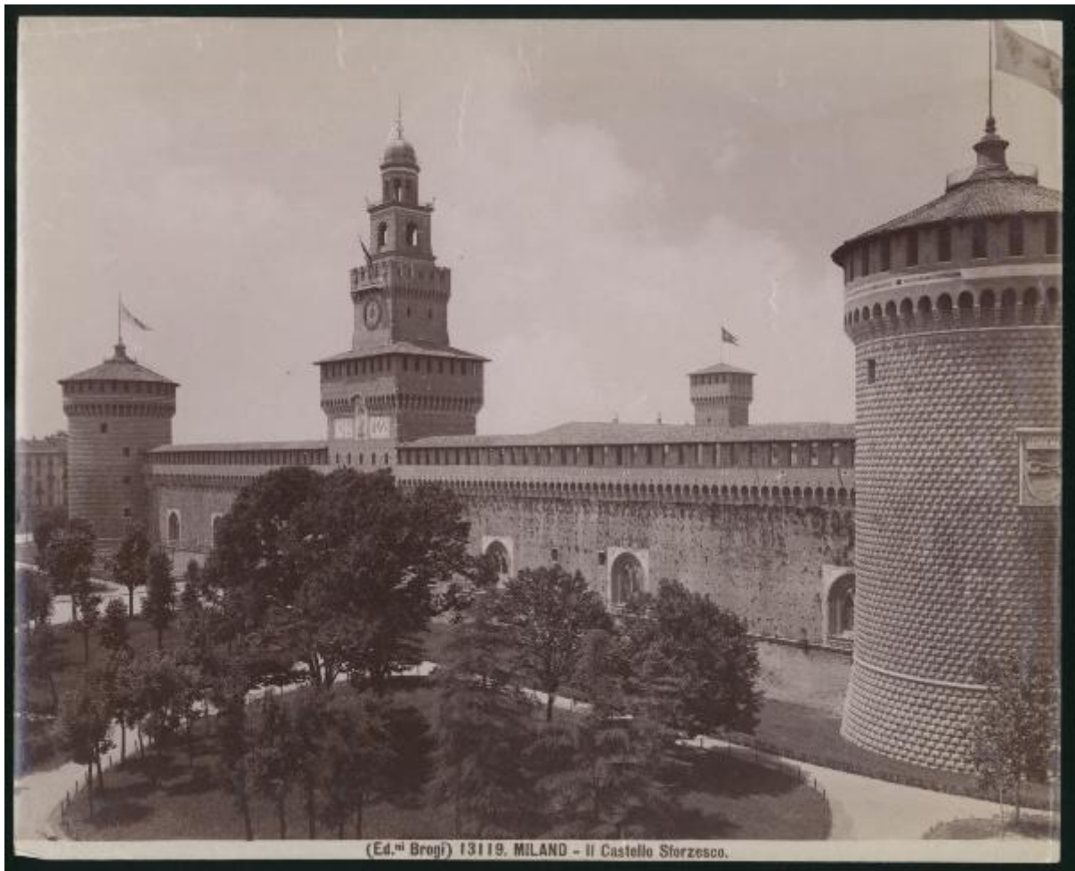
13119. MILANO - Il Castello Sforzesco.