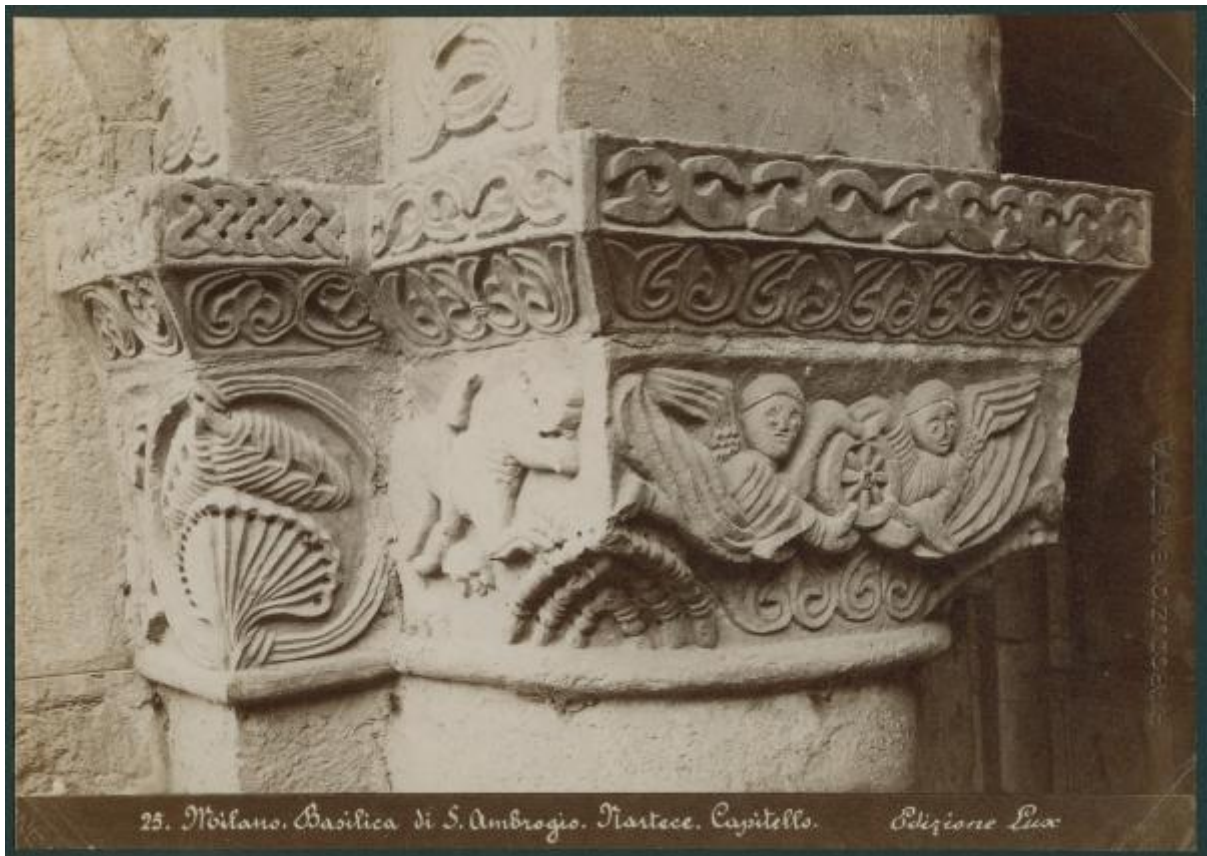
25. Milano, Basilica di S. Ambrogio, Narcece, Capitello. Edizione Lux