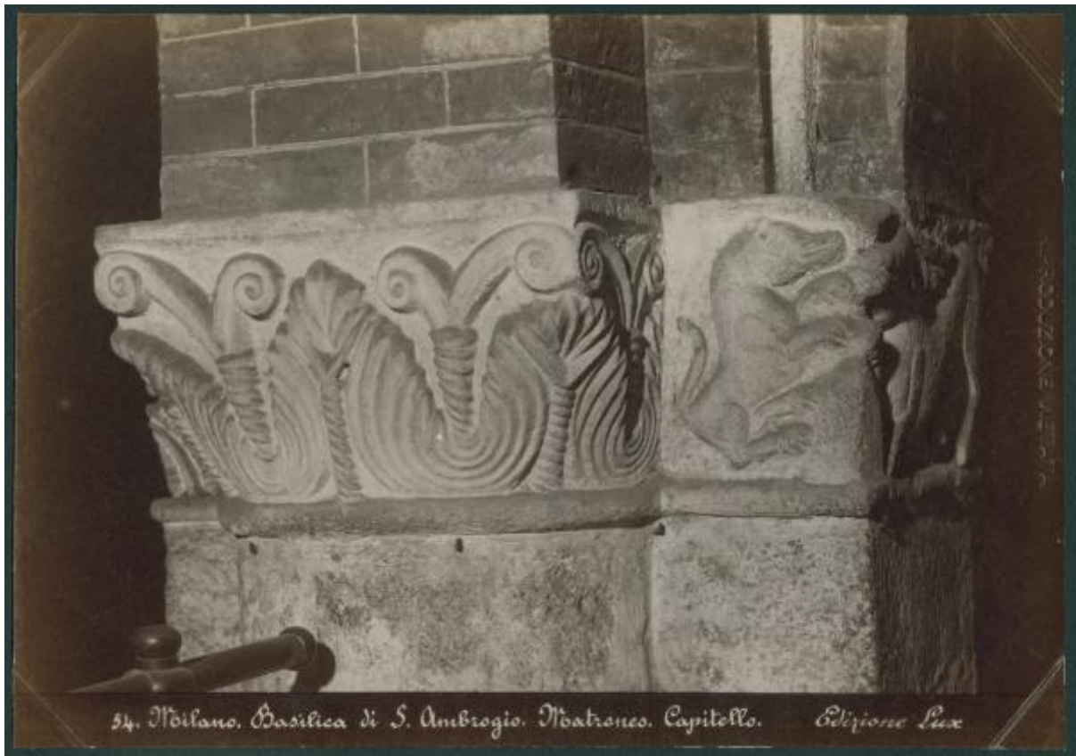
54. Milano, Basilica di S. Ambrogio. Matroneo. Capitello. Edizione Lux