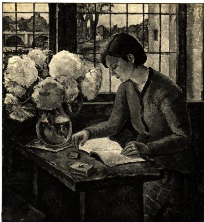
XVII Esposizione Internazionale d'Arte di Venezia