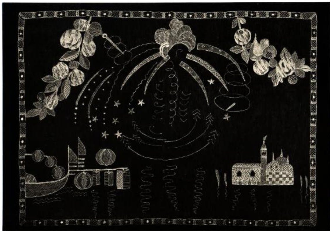
XVII Esposizione Internazionale d'Arte di Venezia N. 283 Cuscino eseguito dalla Ditta Olga Asta e C. di Venezia In punto Burano fondo Tulle su disegno della Contessina Valmarana raffigurante Fuochi d'Artificio