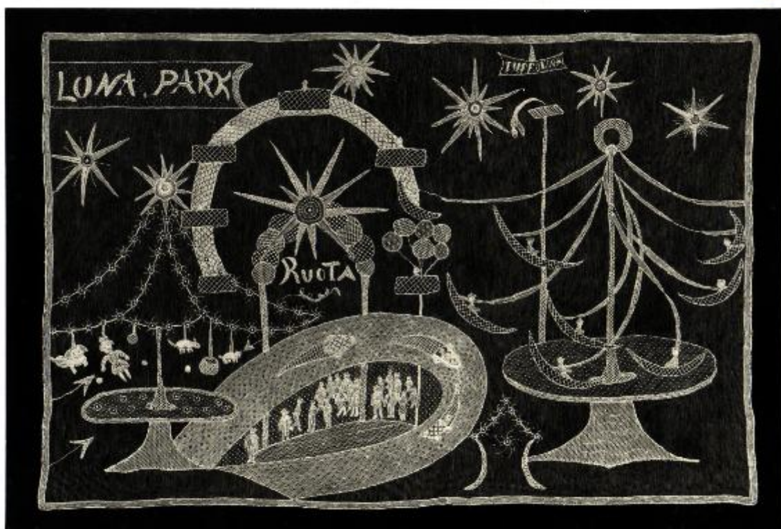
XVIII Esposizione Internazionale d'Arte di Venezia N. 282 Cuscino eseguito dalla Ditta Olga Asta e C. di Venezia in punto Burano fondo Tulle su disegno della Contessina Valmarana raffigurante Luna Park