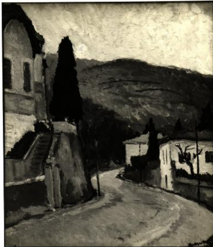
XVII. Esposizione Internazionale d'Arte di Venezia - (498) FOTO GIACOMELLI - VENEZIA Qualino Massimo - STRADA

Link risorsa: https://www.lombardiabeniculturali.it/fotografie/schede/IMM-3a010-0003135/