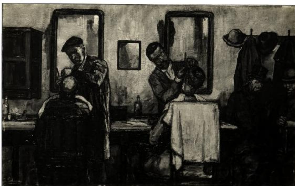
XVIII Esposizione Internazionale d'Arte di Venezia N. 683 Solana Gutierrez José "BARBERIA a BUON MERCATO."