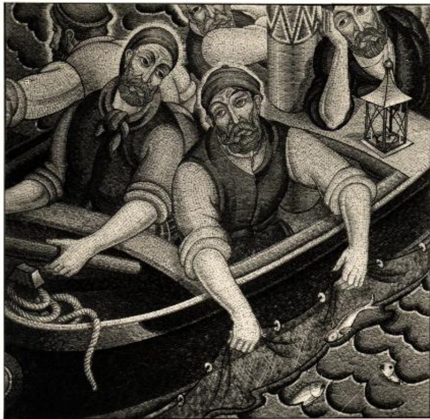
XVIII Esposizione Internazionale d'Arte di Venezia Foto Giacomelli Venezia N. 409 Coop. Mosaicisti Venezia -La barca di S. Pietro,, Mosaico su cartone del pittore Dino Marfisi