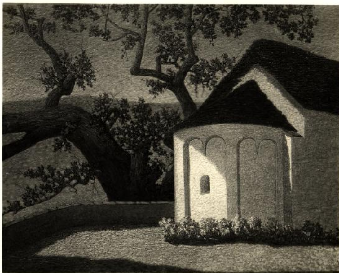
XVII Esposizione Internazionale d'Arte di Venezia