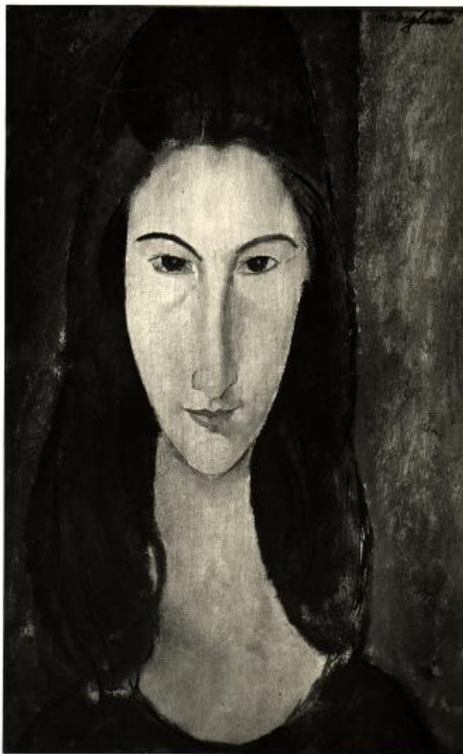
XVIII Esposizione Internazionale d'Arte di Venezia Foto Giacomelli Venezia N. 5588 Modigliani Amedeo TESTA DI DONNA

Link risorsa: https://www.lombardiabeniculturali.it/fotografie/schede/IMM-3a010-0003199/