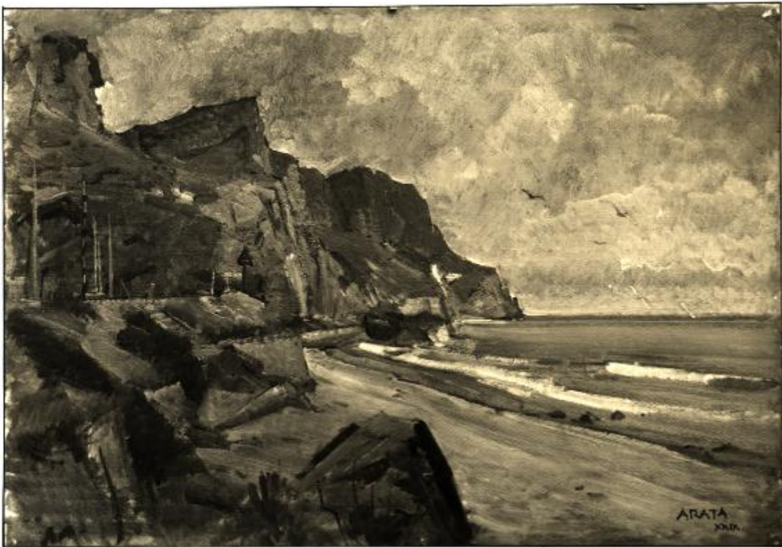
XVII. Esposizione Internazionale d'Arte di Venezia - (1932) Arata Francesco - MARINA CAPO NOLI

Link risorsa: https://www.lombardiabeniculturali.it/fotografie/schede/IMM-3a010-0003200/