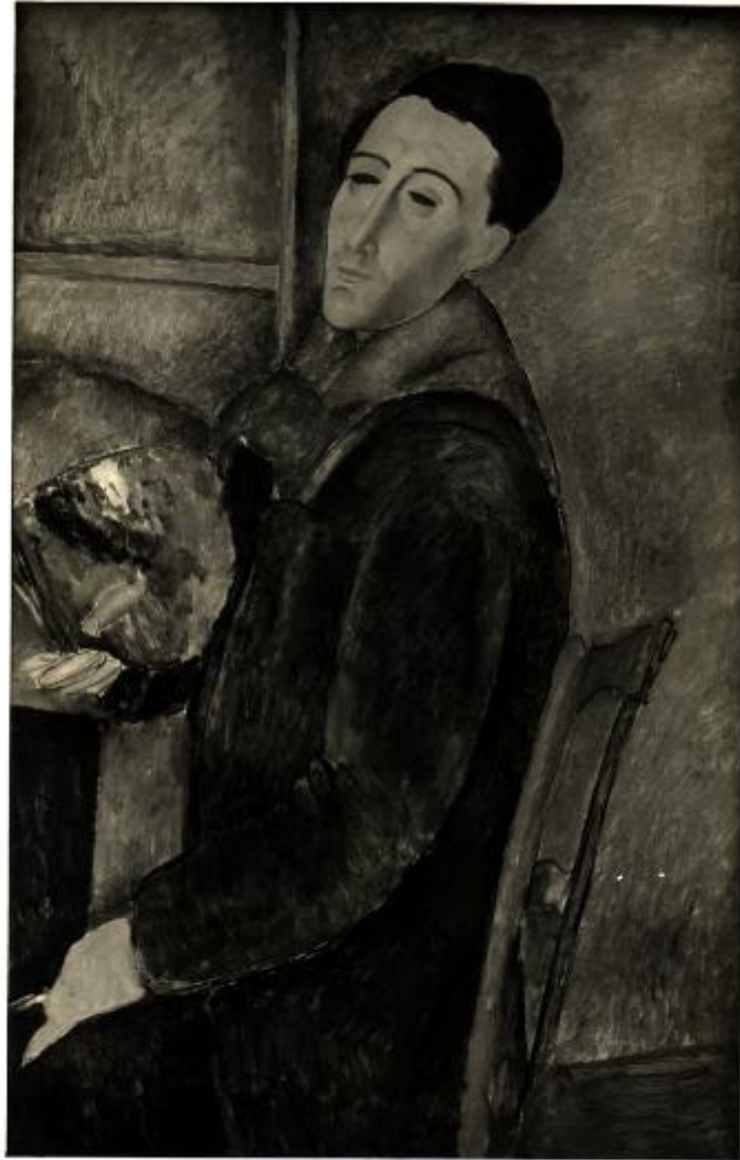
XVII. Esposizione Internazionale d'Arte di Venezia - Modigliani Amedeo AUTORITRATTO (TORINO - COLL. GUALINO) (191)