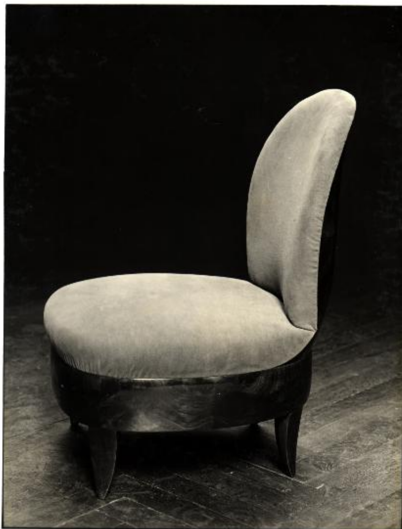
XVIII Esposizione Internazionale d'Arte di Venezia Foto Giacomelli Venezia N. 1046 ENAPI Roma Poltrona in noce Disegno Giov. Guerrini Esec. Ebanisteria Casalini Faenza