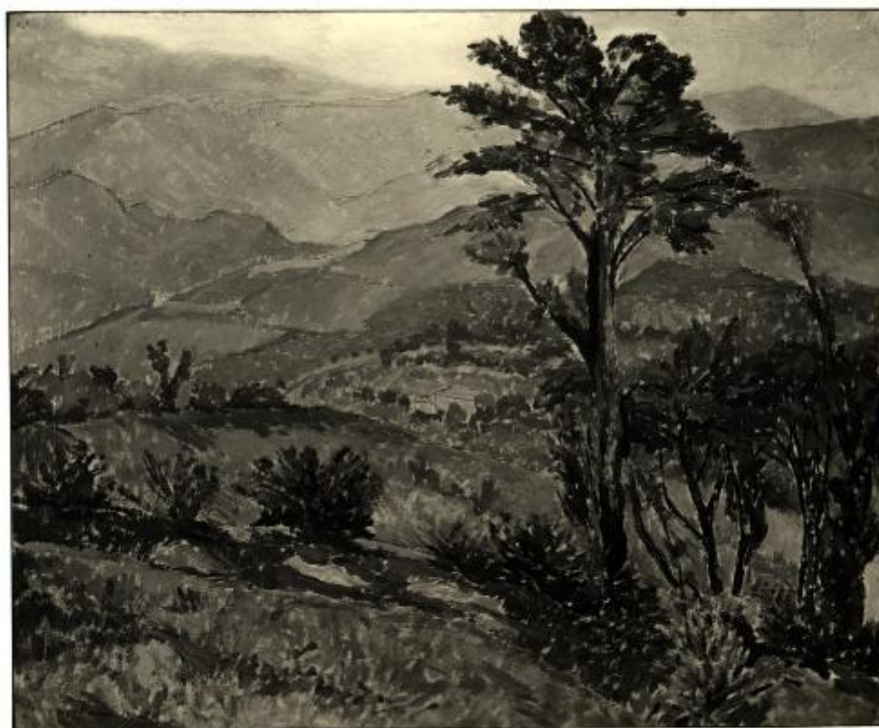
XVII. Esposizione Internazionale d'Arte di Venezia - Pasinetti Nei - PAESAGGIO