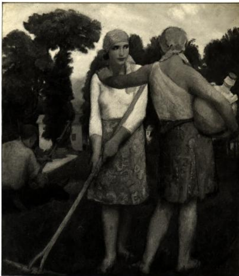
XVII. Esposizione Internazionale d'Arte di Venezia - (1935) Pratili Esodo - GEORGIA